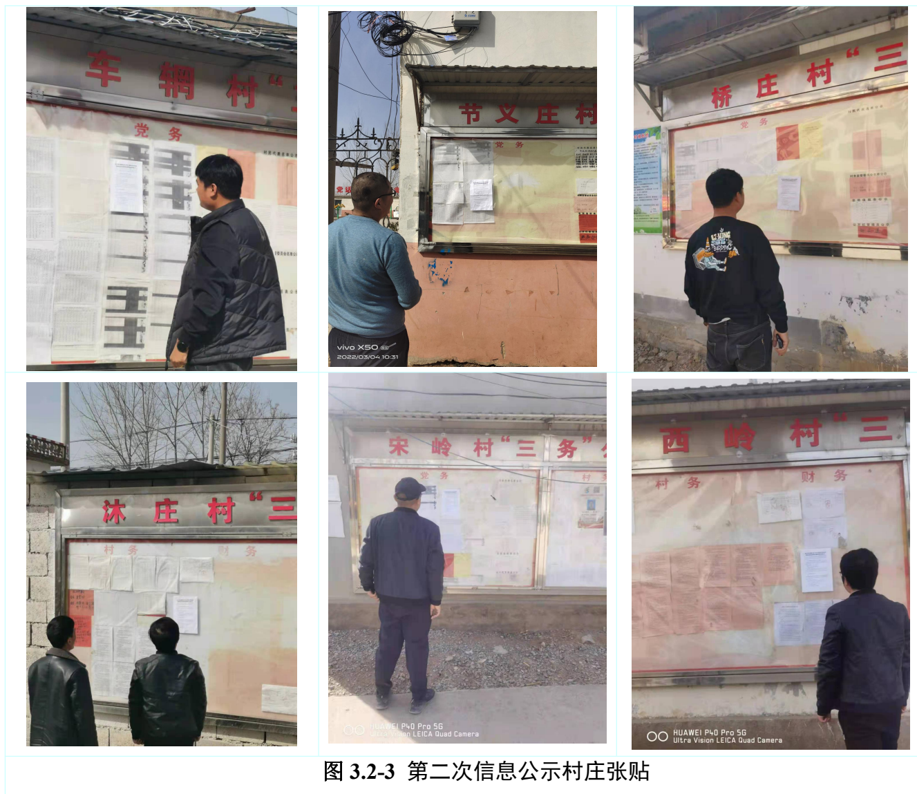
图 3.2-3 第二次信息公示村庄张贴